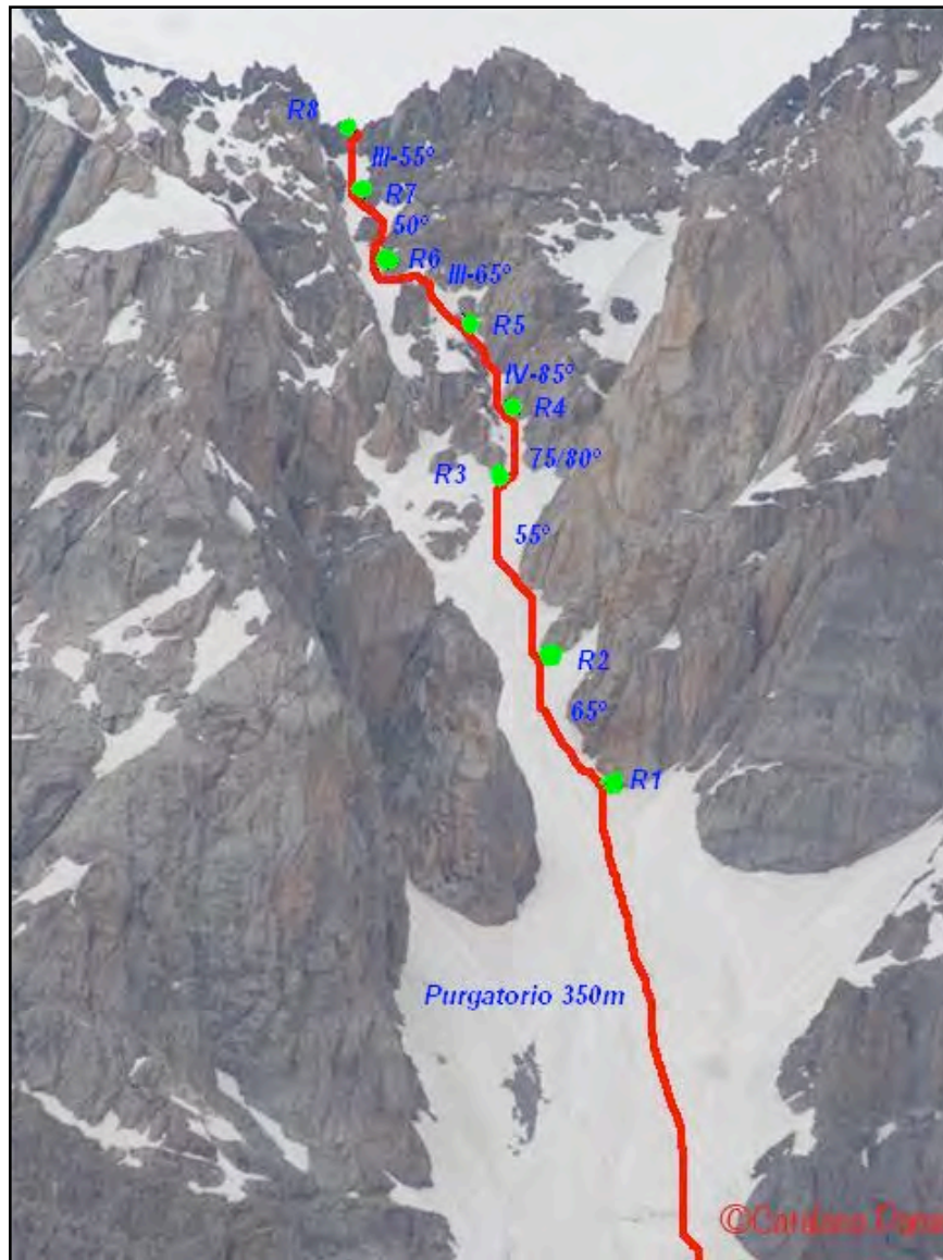
Ressenya corredor Grifone