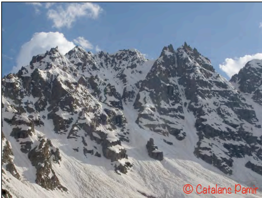
Pic Grifone (punta bifida)