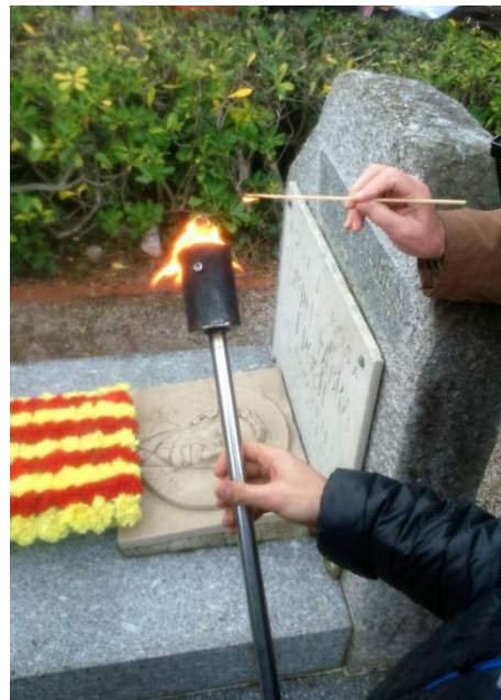
La tomba on es va encendre la primera flama